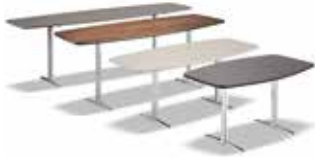
8 WILSON KONSOLE CM 180X50 H55