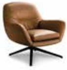
4 JENSEN SESSEL CM 81X85 H78